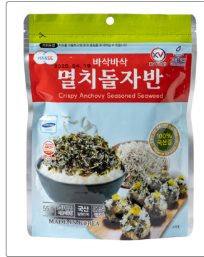
바삭바삭 멸치돌자반 용량 : 55g