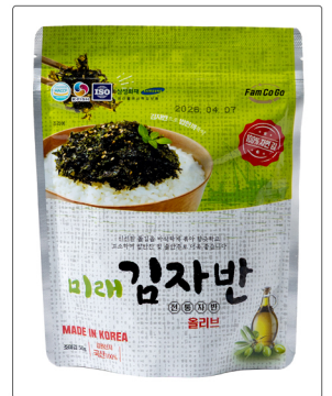
올리브 미래 김자반 용량 : 50g