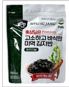
홍삼담은 미역 김자반 용량 : 50g