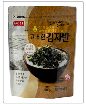
참기름으로 볶은 고소한 김자반 용량 : 50g