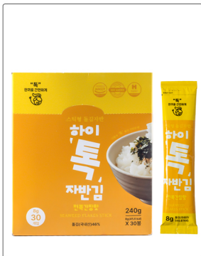
하이특 자반김 용량 : 240g