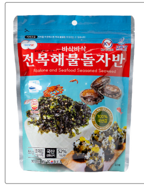
전복해물돌자반 용량 : 55g