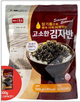
참기름으로 볶은 고소한 김자반 용량 : 500g