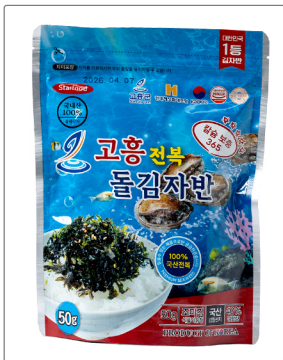
고흥 전복 돌자반 용량 : 50g