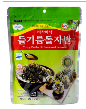
바삭바삭 들기름 돌자반 용량 : 55g