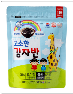
고소한 김자반 용량 : 40g