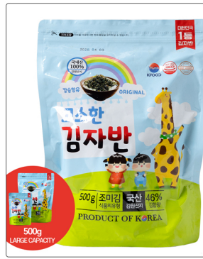
고소한 김자반 용량 : 500g