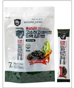
홍삼담은 미역 김자반(스틱형) 용량 : 56g