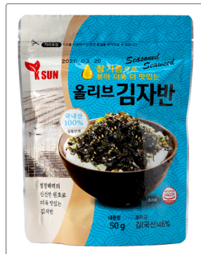
올리브 김자반 용량 : 50g